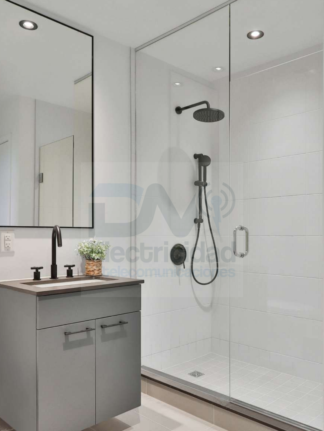
INDOOR - FIXED DOWNLIGHTS